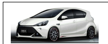
AQUA G SPORTS