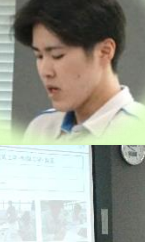
学園概要と前期の 取り組みについて R・S