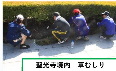
聖光寺境内 草むしり