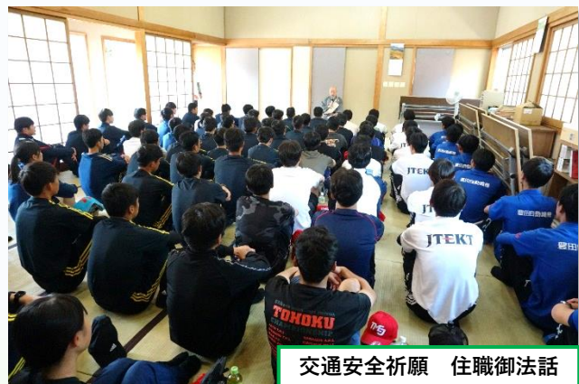
交通安全祈願 住職御法話