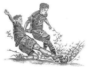
大会テーマ 仲間と共に 心を燃やせ 未来へ繋ぐ オールトヨタ