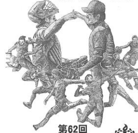
第62回 全豊田訓練生 総合競技大会