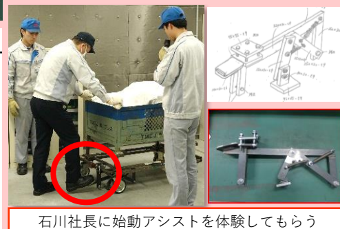
石川社長に始動アシストを体験してもらう