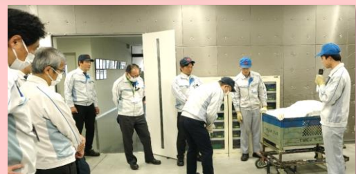
からくりによる無動力始動アシスト装置の説明