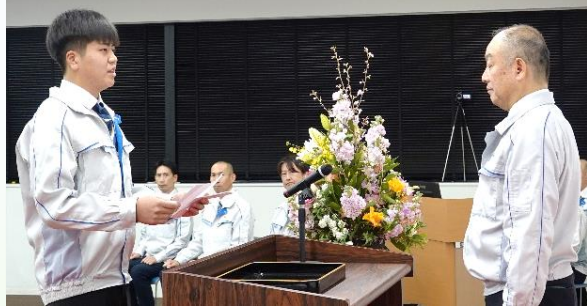
石川社長に誓いの言葉を述べた A・S