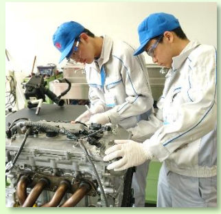
6日間、すべてが貴重な体験となり、より一層、自動車が好きになり、興味を持つことができました。