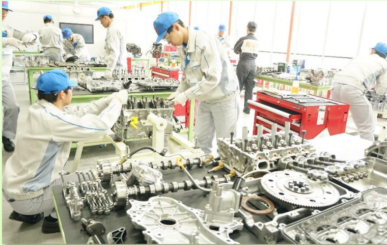
現物で自動車の構造を学ぶのでとても理解が深まります。

花壇自動車大学校で自動車構造実習が行われ、エンジン、マニュアルトランス、アクスル、ディファレンシャル等の分解、組み付けを通じて、自動車のしくみを学びました。