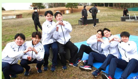
緊張から解放されてリラックスすることも大事な時間です。 みんなと仲良く、励まし合って乗り越えました。