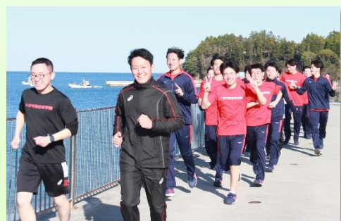
ランニングして気分をリフレッシュ！ 1日の訓練を終えます。